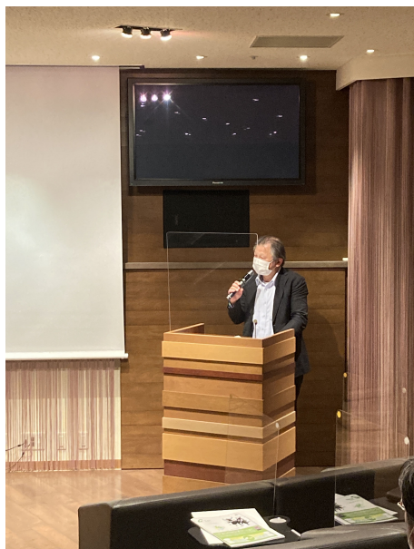
マップソリューション株式会社様