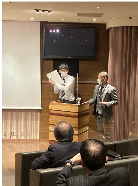
株式会社東京ミライズ様